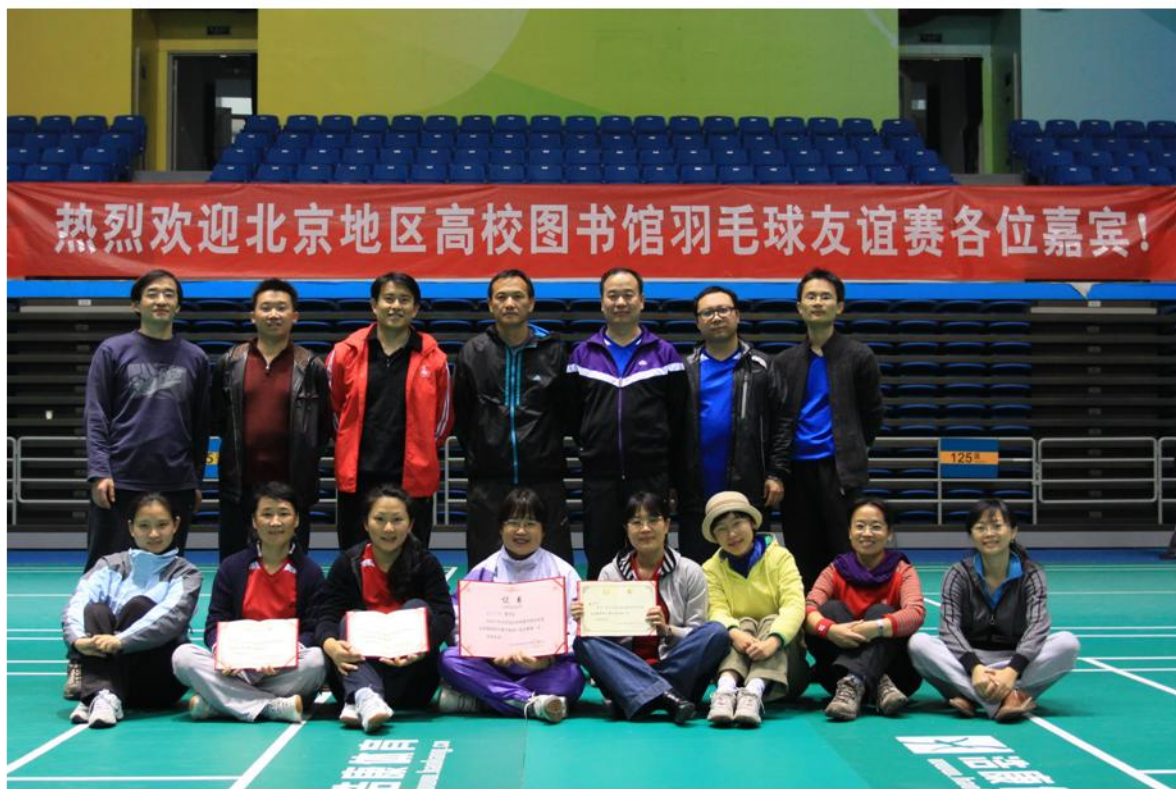
北大图书馆羽毛球队团体合影

本次比赛共设女子单打、男子单打及团体赛三项。在上午开始的团体赛中，全部20支代表队分为A、B、C、D共四组进行比赛。组内循环对战，每场比赛含男、女单打各一局及混双一局。我馆代表队在C组，凭借在男女单打上的突出实力，分别以四个2:0战胜对手，成为小组第一，与其他三组的小组第一名（清华大学图书馆、北京师范大学图书馆及北京工业大学图书馆）并列团体比赛一等奖。