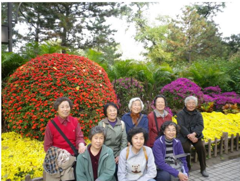
姐妹花——编目部退休的老师合影