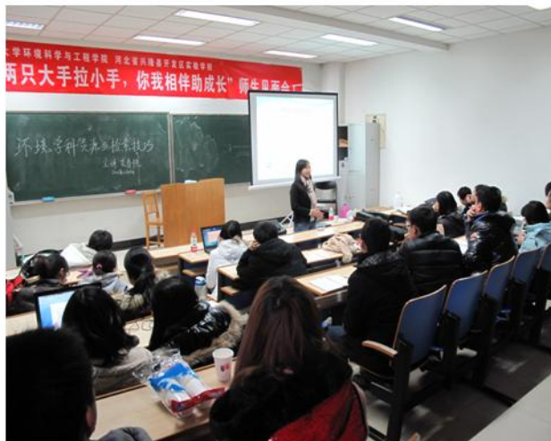
学科馆员在环境与工程学院举办讲座

为提高北大师生教学科研的效率，图书馆信息咨询部的学科馆员近期集中为各院系提供检索培训讲座活动，活动以“来到您身边的学科讲座”为宣传口号，并辅以相应的宣传材料。学科馆员根据硕士、博士研究生各阶段的需求精心准备了三方面内容，包括学术资源和服务概览、专业资源和检索技巧介绍、以及如何利用资源撰写论文等，以期帮助学生“快”、“全”、“准”地找到文献，充分利用校内的各种信息资源。同时，院系老师还可以根据需求订制培训讲座。