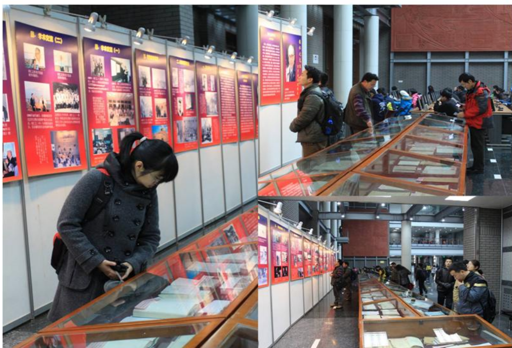
侯仁之百岁寿辰展览

本次展览内容丰富，解说详尽，吸引了众多读者驻足观看。侯仁之先生的道德风范和学术成就，必将激励后学潜心学术，再创辉煌。 □