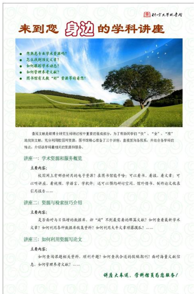
学科馆员下系培训宣传单

“来到您身边的学科讲座”的宣传材料发出之后，图书馆陆续接到了来自多个院系发出的邀请，信息咨询部于近日陆续在哲学系、化学学院、心理系、历史系、环境与工程学院等院系开展了面向研究生的专场讲座。这些讲座培训有邀请数据库公司的专业培训师来做的针对某个数据库的专门培训，也有信息咨询部学科馆员举办的帮助研究生查找资源的图书馆资源与特色服务的专场讲座。通过这些讲座和培训，研究生们对图书馆的资源有了更多的了解，对如何查找资源有了更深的认识。对这种深入院系举办讲座与培训的形式，师生们给予了热烈的欢迎和高的评价。