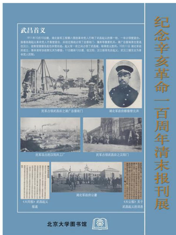
辛亥百年纪念展展板之一

展览不仅展出了百年前的珍贵报刊实物，让读者集中了解了有关辛亥革命的各种馆藏报刊情况，还展示了不少难得一见的历史图片，吸引了大批参观者，取得了很好的效果。参观过程中，有不少读者留下了他们的评论和感想，如一位老先生留言：“很好！希望今后有关的重大事件都举办相应的展览。”