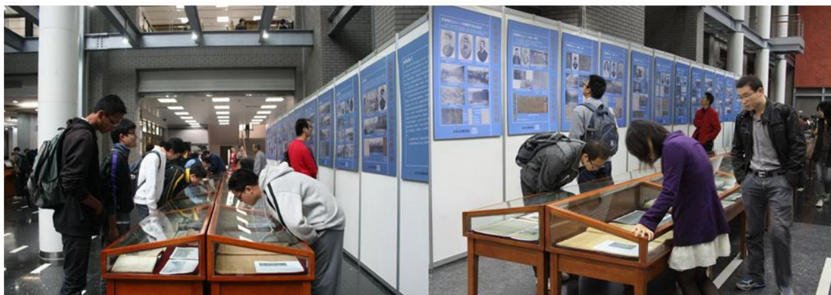
生动直观的展览吸引了很多参观者