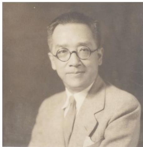
胡适先生1946年前后照片

胡适是中国近代文化史、思想史、学术史、政治史上最具影响、备受关注的人物之一。他与北京大学有着深厚的渊源，因此对北京大学也贡献颇多。特别值得一提的是，胡适曾于1957年在纽约立下遗嘱，将留存大陆的102箱藏书资料捐赠北京大学，因历史原因，胡适遗嘱并未完全落实，其藏书现存北大图书馆，手稿书信等资料现存社科院近代史所。2011年12月17日是胡适诞辰120周年纪念日，图书馆特举办此展作为纪念。