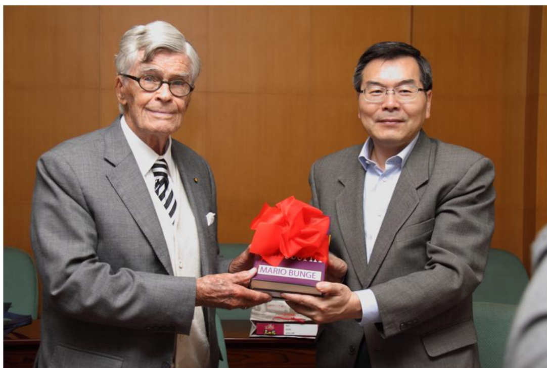
加拿大麦吉尔大学 Mario Bunge 教授向北京大学捐赠学术著作

邦格是一位多产的知识分子，著有80多部书籍和400多篇论文，尤其是具有里程碑意义的8卷丛书《基础哲学论述》，是对于哲学各个方面的综合而严格的研究，成为现代哲学的基础：包括