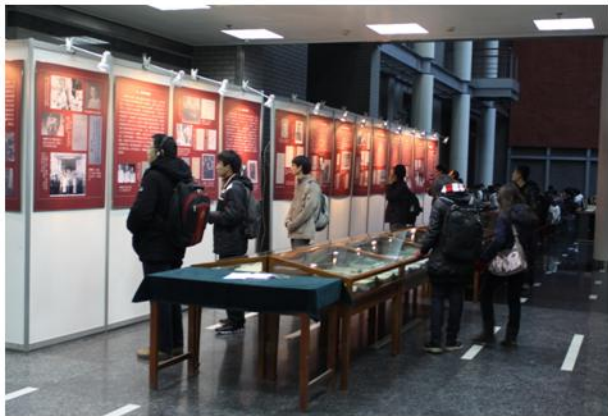
纪念胡适诞辰120周年胡适生平著作展

此次展览的展板部分主要分十个阶段介绍胡适的生平事迹，除了胡适的照片外，还展出了胡适藏书中一些珍贵的资料图片。书刊展览部分，分为“白话诗”、“短篇小说翻译”、“文学革命”、“整理国故”、“古典小说研究”、“《水经注》研究”、“著作版本”等十三个主题，共展出民国时期报刊、胡适著作各种版本等160余件，包括胡适藏书中的自校本、题赠本等，受到广大师生一致好评。