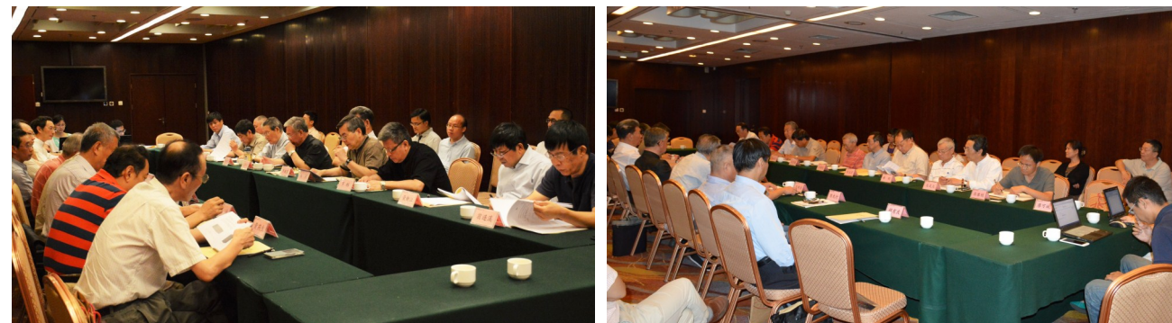
“《‘大仓文库’精品丛编》选目与《‘大仓文库’全文数字化》研讨会”现场