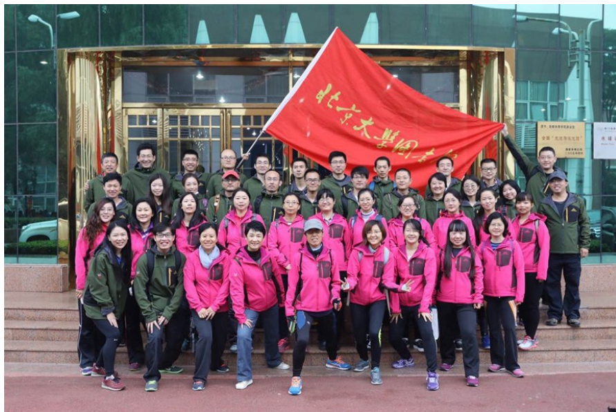
图书馆代表队吹响集结号

本次十运会通知发布后，图书馆积极动员、组织有序，书记馆长带头参赛，众多馆员踊跃报名，从参赛信息统计、比赛物资采购及发放、到比赛现场的协调指挥等各个环节都有条不紊、细致周到，确保奔