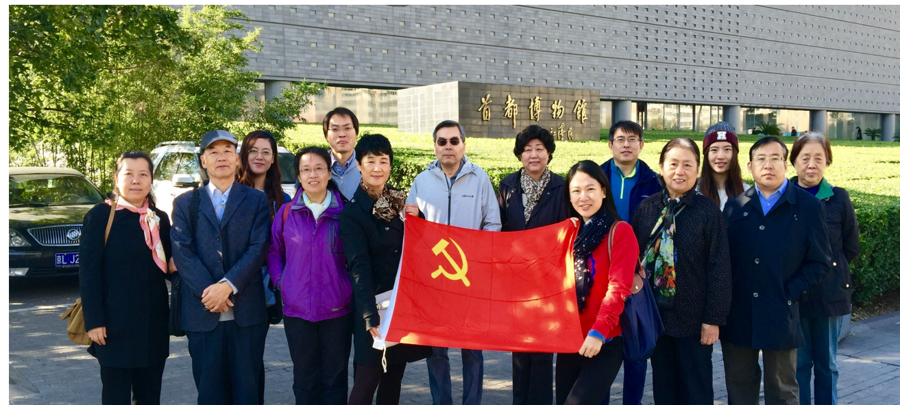
综合管理与协作中心党支部合影

为深入开展“两学一做”活动，积极响应学校号召，10月23日综合管理与协作中心党支部，前往首都博物馆学习交流，参观“走进养心殿”、“大元三都”、“匠心筑梦烁古今——燕京八绝”等展览，进行“立足岗位，恪尽职守，做新时期合格党员”大讨论。