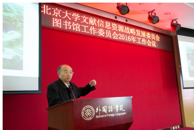
吴志攀常务副校长讲话

9月29日，“北京大学文献信息资源战略发展委员会暨北京大学图书馆工作委员会”2016年工作会议在外国语学院分馆成功召开，本次会议的主题是“图书馆新馆建设及近期工作进展”。北京大学常务副校长吴志攀、包括校外专家、院系领导、职能部门领导、师生和图书馆代表在内的40多名委员出席会议。图工委下设的专业工作组成员、总馆以及院系分馆代表列席了会议。会议由北京大学文献信息资源战略发展委员会副主任、北京大学图书馆馆长朱强主持。