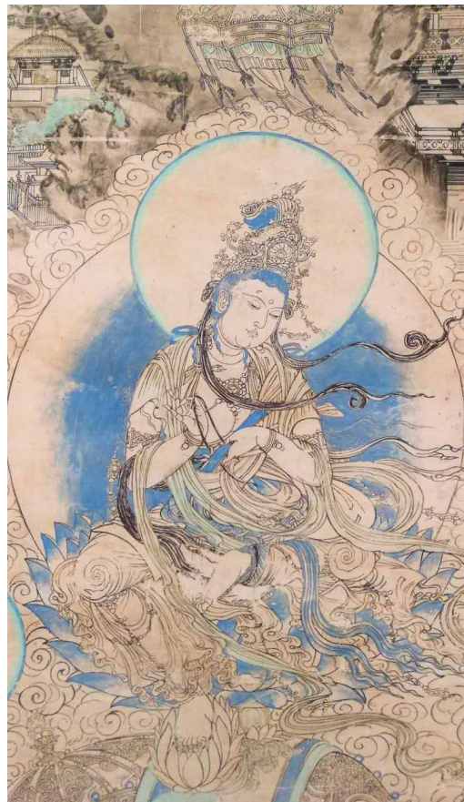
榆林窟第3窟西夏《普贤变》 《千年敦煌——敦煌壁画艺术精品展》 北京大学赛克勒考古与艺术博物馆