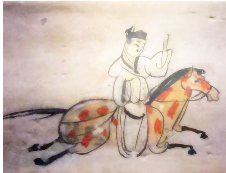
嘉峪关魏晋墓葬群5号墓前室北壁东侧“驿使图”壁画砖 甘肃省博物馆