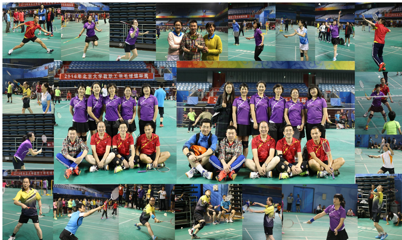
图书馆羽毛球队青春不老，疯“羽”无阻！

10月10-14日，2016年北京大学教职工羽毛球锦标赛（混合团体）在邱德拔体育馆举行。全校共有60支代表队400余名选手报名参加本届比赛，其中甲组16队，乙组44队。图书馆羽毛球队作为传统劲旅，一直跻身甲组行列，同时，也组成图书馆二队参与乙组竞技。