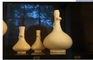
中国瓷瓶 大英博物馆