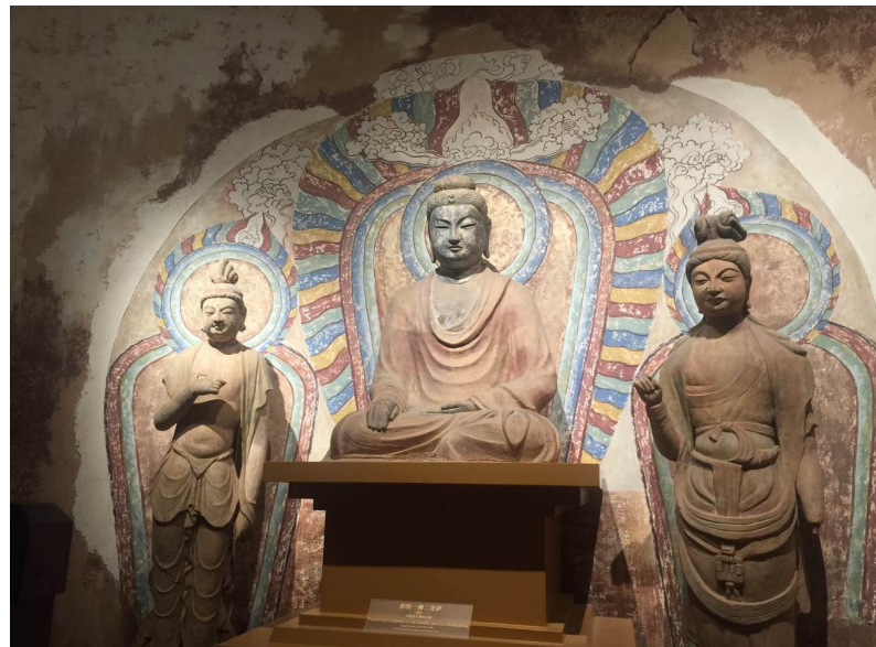
天梯山石窟第3窟《一佛二菩萨》造像 甘肃省博物馆

主 编：刘素清 责任编辑：雨 虹 摄 影：宋庆生 王爱农 邹新明 打 印：北京大学数字加工中心