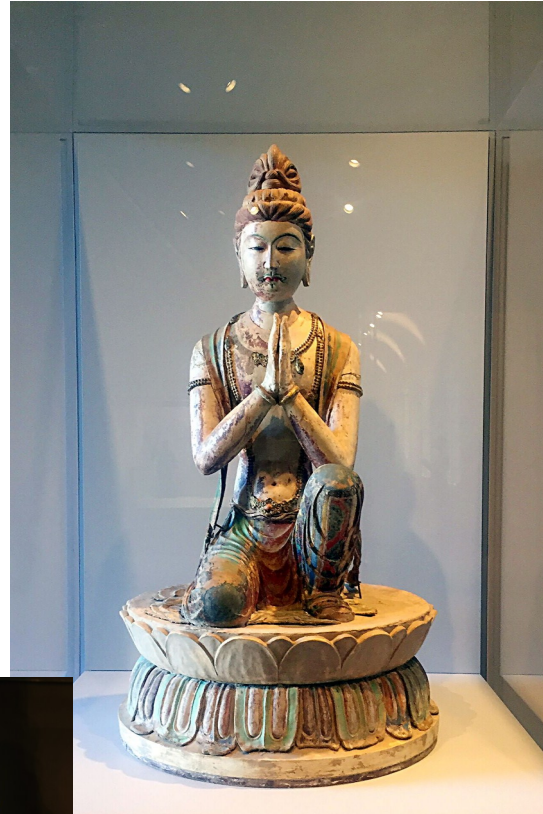
莫高窟第328窟唐代彩塑造像 哈佛大学艺术博物馆