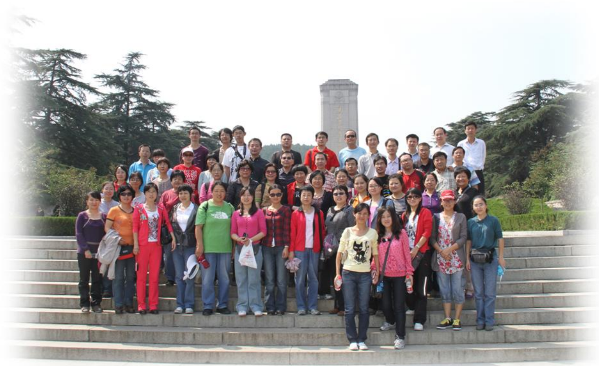
图书馆党委和医学馆党支部在内的50多名党员在淮海战役纪念塔前留影

全体党员首先瞻仰了面向朝阳、巍然耸立淮海战役纪念塔，参观了五常委雕像以及领导题字，领略了革命将领们运筹帷幄、卓越指挥的气魄。在淮海战役纪念馆里，党员们仔细观看每一件珍贵的资料和实物，认真聆听每一段历史故事，通过参观进一步了解了淮海战役胜利的诸多因素及伟大意义。