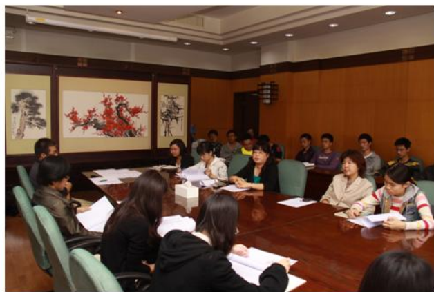
学生助理员集中培训会议现场

为解决图书馆各阅览室值班任务繁重、现有人力严重不足的问题，同时也为家庭经济困难的同学开辟勤工助学的新渠道，北大学生资助中心和北京大学图书馆从上学期就开始酝酿，联合招募学生助理员参与图书馆的值班工作。本学期开学后，学生资助中心的老师和图书馆密切配合，在较短的时间内就按图书馆的岗位需求选拔出了50多名学生助理员。