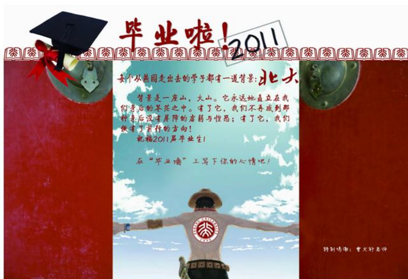
精美大气的“毕业墙”

2011年毕业季前夕，图书馆信息咨询部特别制作了“毕业墙”，为毕业生提供一个抒发情感、寄托祝福的平台。该活动一经推出，立即受到了学子们的热情响应，不仅在墙上纷纷留言，也让毕业墙成为了图书馆里毕业生拍照留念的“景点”之一。