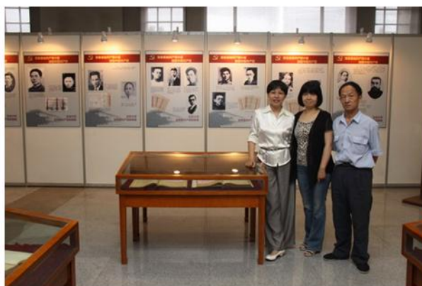
特藏部人员在展览现场合影留念