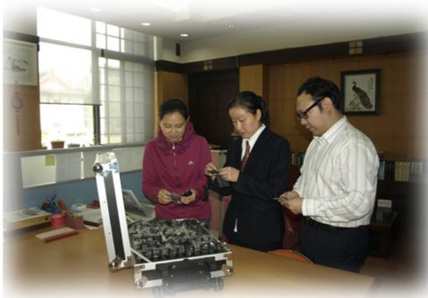
工作人员在准备无线同声传输设备

图书馆的迎新工作是每年学校新生入校教育工作重点之一，是学生利用图书馆的开端和基础。为确保工作的顺利进行，图书馆除了一如既往地重视和支持此项工作外，2011年的最大亮点是首次启用无线同声传输设备，收效良好。