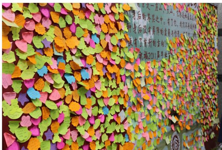
五彩的贴纸，五彩的毕业心情